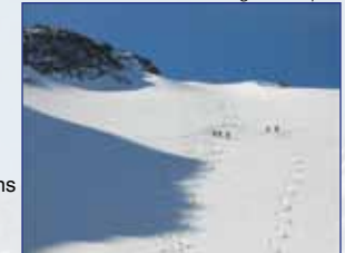
Aufstieg zum Gipfel

Ausgangspunkt: Lüsens bzw. Westfalenhaus Höhenunterschied: 1.580 m Gehzeit: ab Lüsens 4,5 – 5 Std., ab Westfalenhaus: 2,5 – 3 Std. Anforderung: wenig schwierig; gute Kondition erforderlich