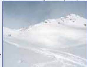
Aufstieg zur Lampsenspitze

Ausgangspunkt: Praxmar Höhenunterschied: 1.195 m Gehzeit: ca. 2,5 – 3 Std. Anforderung: leicht