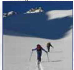
Aufstieg durch das Schöntal

Ausgangspunkt: Lüsens Höhenunterschied: 1.370 m Gehzeit: 3-3,5 Std. Anforderung: wenig schwierig