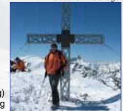
Am Winnebacher Weißkogel

Ausgangspunkt: Parkplatz Gasthof Lüsens Höhenunterschied: 1.550 m Gehzeit: ab Lüsens 4,5 – 5 Std., ab Westfalenhaus 3 Std. Anforderung: wenig schwierig, aber gute Kondition erforderlich