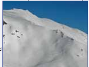
Aufstieg zum Praxmarer Grieskogel

Ausgangspunkt: Praxmar Höhenunterschied: 1.020 m Gehzeit: 2,5 – 3 Std. Anforderung: wenig schwierig