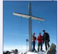
Gipfelkreuz am Lisenser Fernerkogel

Ausgangspunkt: Parkplatz in Lüsens Höhenunterschied: 1.665 m Gehzeit: 5 Std. Anforderung: ziemlich schwierig